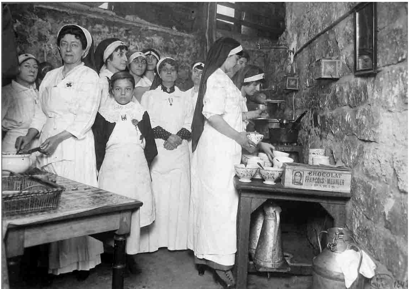
La cuisine pour les réfugiés