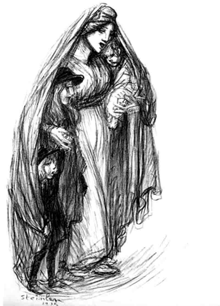
Les orphelins par Steinlen 1915