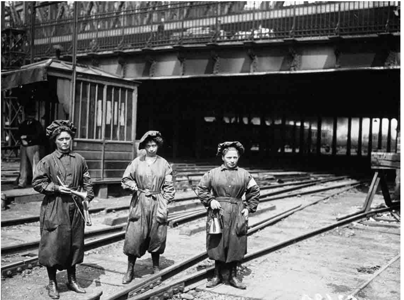
gare du nord, femme grasseuse et surveillante de signaux 1917