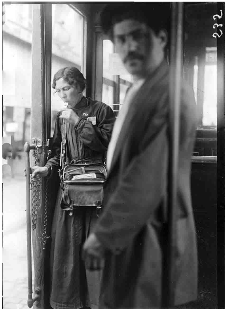
femme contrôlease de tramway début septembre 1914