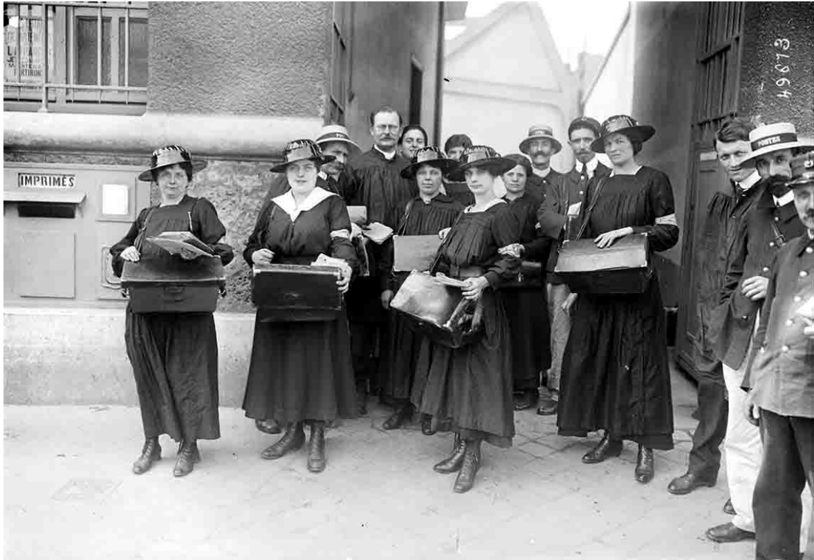
les premières femmes facteurs le 1er juin 1917