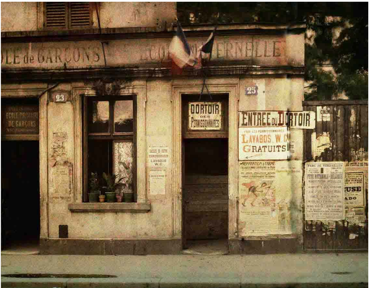
L'école maternelle de la rue des Récollets est réquisitionnée pour en faire un dortoir