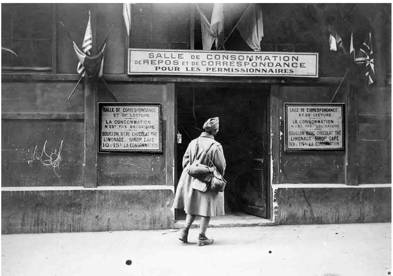
Une salle de consommation est ouverte pour les permissionnaires rue du Faubourg-Saint-Martin