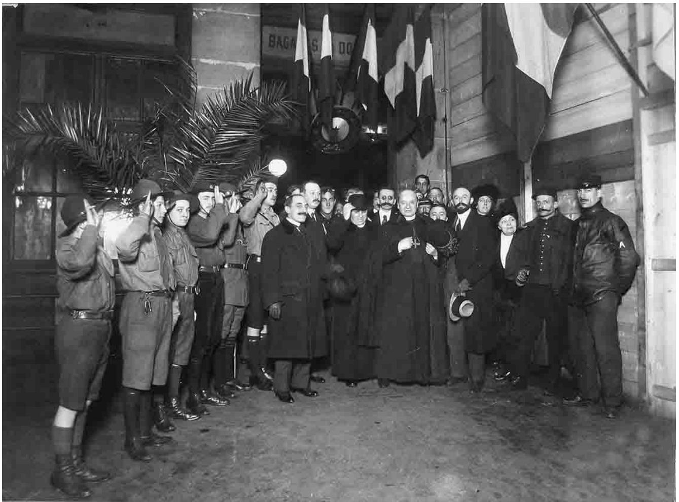
Visite du cardinal Arnette à l'Œuvre des réfugiés le 17 octobre 1914