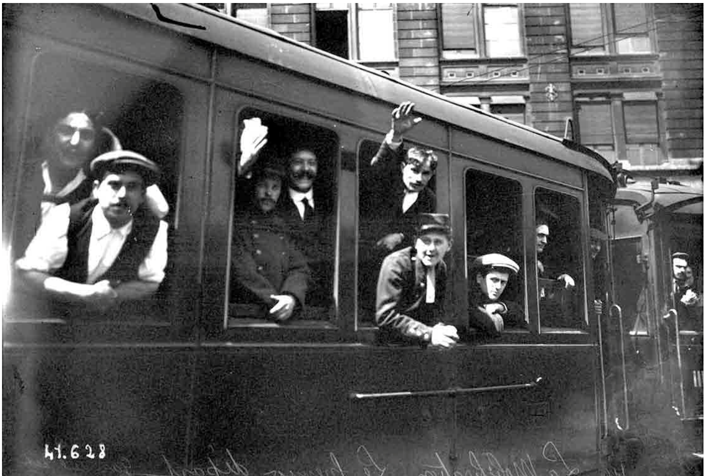
Départ de la gare de l'Est d'un train de mobilisés heureux