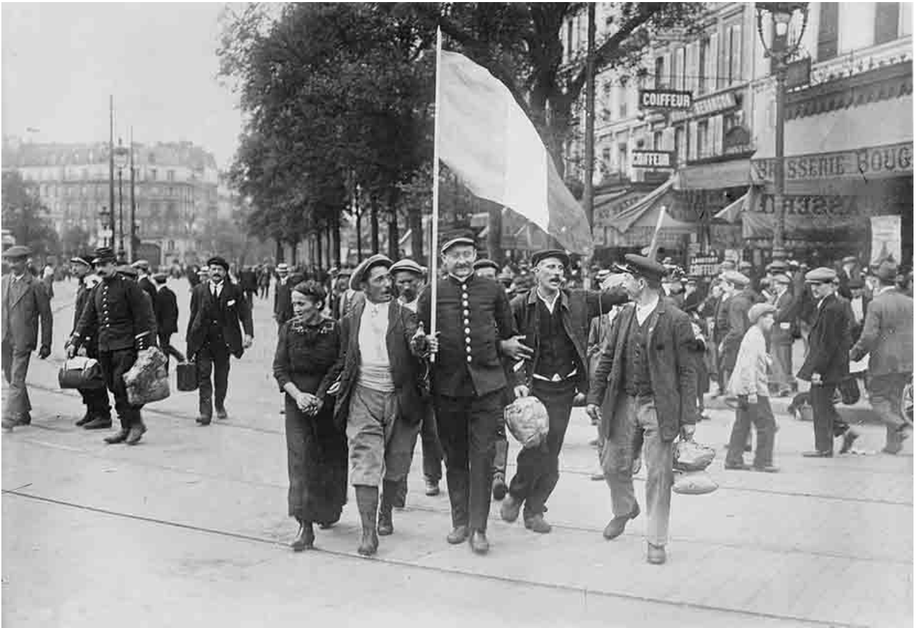
Mobilisés arrivant à la gare de l'est