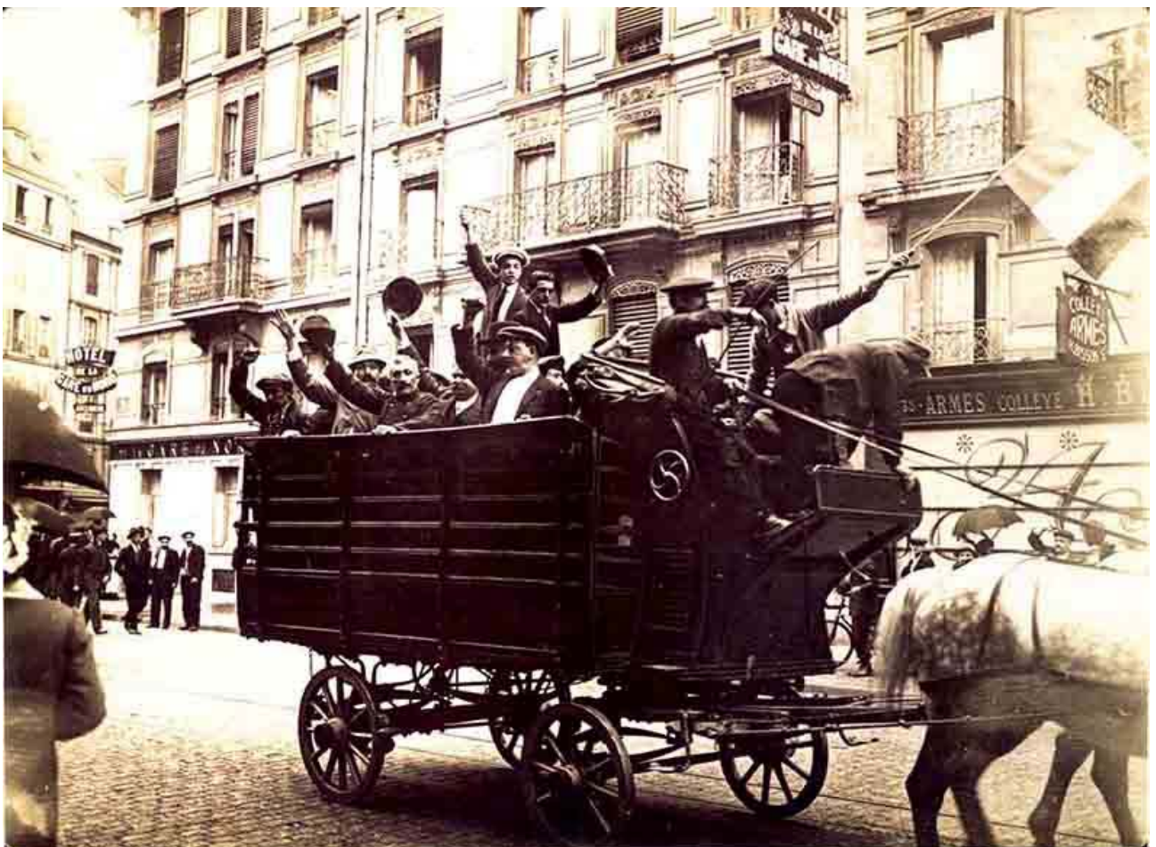
Mobilisés chantant la marseillaise rue Saint-Quentin 1914