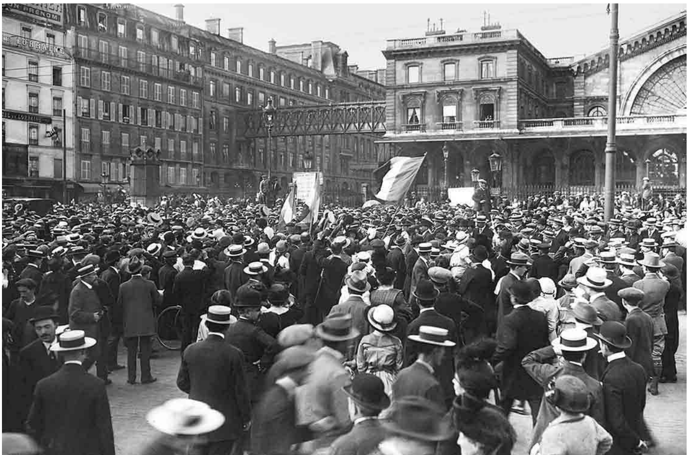
Mobilisés devant la gare de l'Est le 2 août 1914