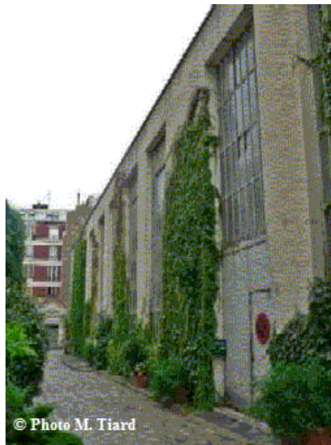
Atelier René Tazé : La Villa du Lavoir, 70 rue René-Boulanger, Paris 10 e

4) Dimanche 16 septembre, de 10h à 12h et de 14h à 18h : René Tazé ouvre les portes de son atelier de « Gravure de taille douce » : Le maître graveur taille-doucier fera visiter ses nouveaux locaux à la Villa du Lavoir. Il fera une démonstration des œuvres gravées. - RV : Villa du Lavoir , 70 rue René-Boulanger, 75010 Paris, entrée libre - M o République ou Jacques-Bonsergent.