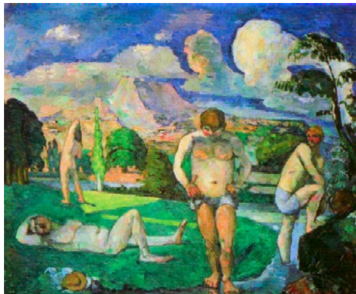
Le tableau des baigneurs de Cézanne, l'un des legs de Caillebotte à l'Etat

3) Samedi 15 septembre à 20 h et Dimanche 16 septembre à 18h : Lecture-Concert autour du « Legs Caillebotte, le bel héritage maudit » en collaboration avec les associations « Autour du Père Tanguy » et « l'Atelier Porte-Soleil ». Il s'agit d'évoquer le legs à l'État de la collection du peintre Gustave Caillebotte, oeuvres achetées à ses amis peintres : Renoir, Cézanne, Manet, etc. Comment ce legs a été accueilli par l'État. Évocation en images, poèmes et musique. - RV : Atelier Porte-Soleil , 57 rue des Vinaigriers, 75010 Paris, entrée libre : 35 personnes maximum par séance, réservation à partir du 5 septembre au : 01 46 74 62 48 ou par mail à : atelierportesoleil@tele2.fr - M° Jacques-Bonsergent ou République.