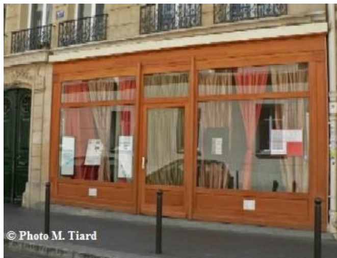
L'atelier Porte-Soleil, 57 rue des Vinaigriers, Paris 10 e

4) Dimanche 16 septembre, de 10h à 12h et de 14h à 18h : René Tazé ouvre les portes de son atelier de « Gravure de taille douce » : Le maître graveur taille-doucier fera visiter ses nouveaux locaux à la Villa du Lavoir. Il fera une démonstration des œuvres gravées. - RV : Villa du Lavoir , 70 rue René-Boulanger, 75010 Paris, entrée libre - M o République ou Jacques-Bonsergent.