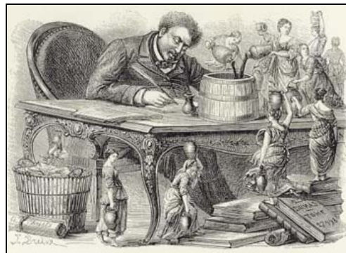
Caricature de Dumas

Alexandre Dumas fils et Roger de Beauvoir connaissaient bien le quartier, car nombre de leurs pièces furent créées dans les théâtres du boulevard. Une quinzaine des pièces de Dumas fils le furent au Gymnase 3 , sauf la plus célèbre, La Dame aux Camélias , qui se joua au Vaudeville 4 en 1852. Et citons une pièce de Roger de Beauvoir créée aux Variétés 5 en 1840, Le Chevalier de Saint-Georges . Celui-ci, fils d'une esclave africaine et d'un petit noble de la Guadeloupe, fut un illustre musicien. Mais ce directeur de la musique de Marie-Antoinette fut aussi célèbre comme escrimeur, tout comme de Beauvoir, grand ami de Dumas père. C'est son roman l'Écolier de Cluny qui inspira à Dumas sa Tour de Nesle , triomphe du drame romantique, créé au Théâtre de la Porte Saint-Martin en 1832 et joué un nombre incalculable de fois !