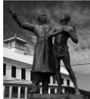
Abolition de l'esclavage Statue de Schoelcher à Cayenne (Guyane)