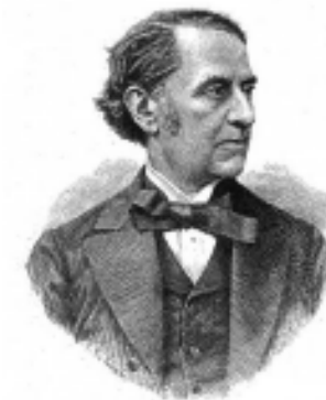
Louis Blanc, républicain, ami de Schoelcher