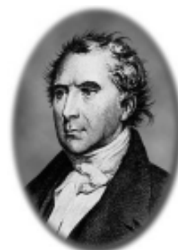
François Arago (1786-1853)

RV : Place de l'Île de Sein, Paris 14 e (statue d'Arago)