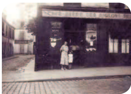
• Café Moinon rue du Buisson St-Louis.