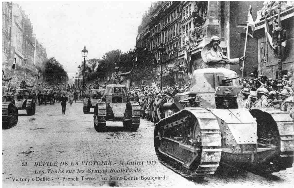
23 DÉFILE DE LA VICTOIRE - 14 Juillet 1919 Les Tanks sur les Grands Boulevards "Victory's-Defile - "French Tanks" in Saint-Denis Boulevard