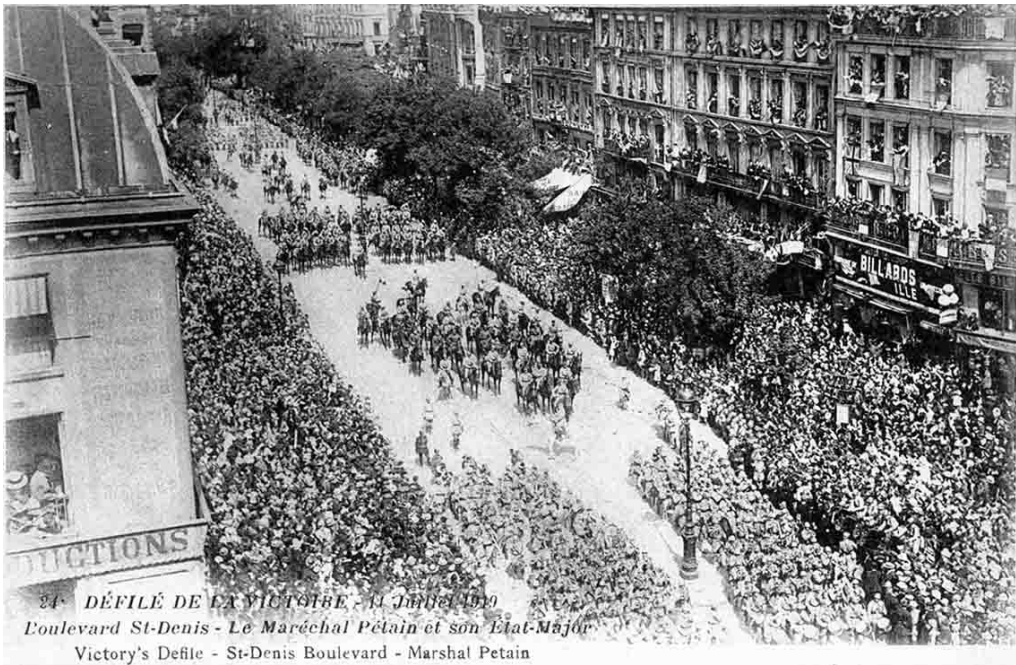
24. DÉFILÉ DE LA VICTOIRE - 14 Juillet 1919 Boulevard St-Denis - Le Maréchal Pétain et son Etat-Major Victory's Defile - St-Denis Boulevard - Marshal Petain