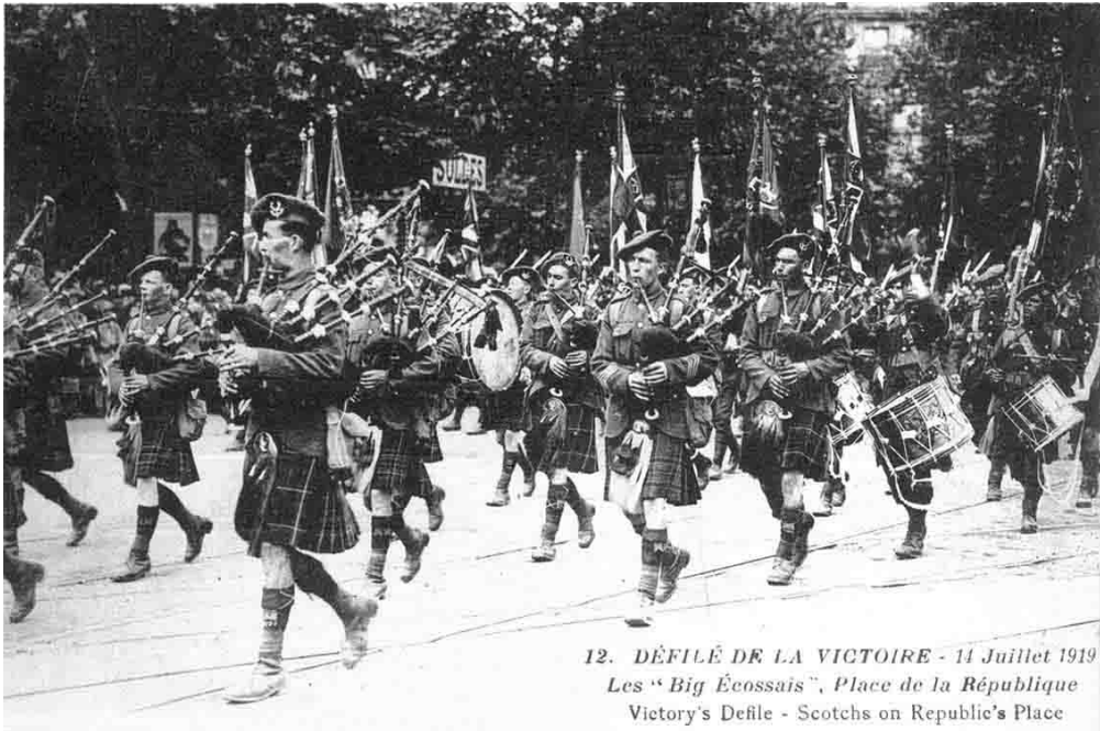
12. DÉFILÉ DE LA VICTOIRE - 14 Juillet 1919 Les "Big Écossais", Place de la République Victory's Defile - Scotchs on Republic's Place