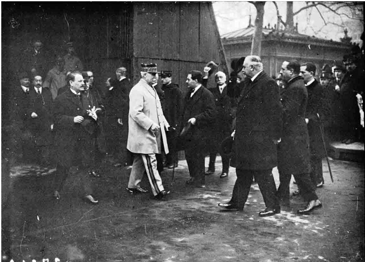
Le maréchal Pétain quitte le diorama après son inauguration.