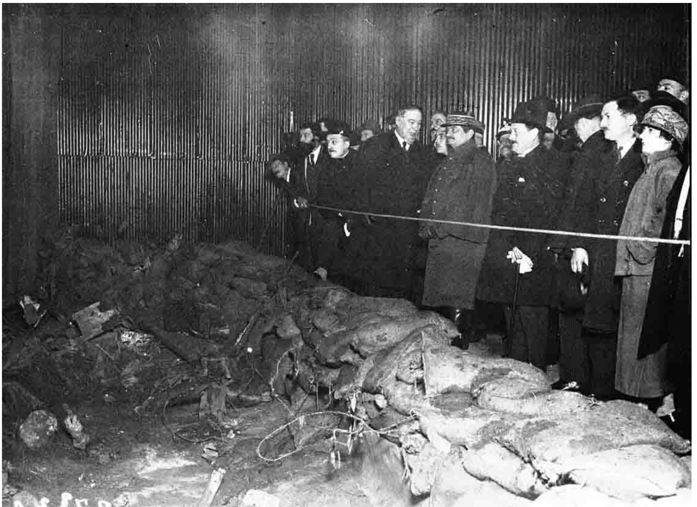
Le 9 février 1923, place de la République, a été inauguré un diorama, créé par le peintre Charles Fouqueray, représentant le fort de Douaumont.