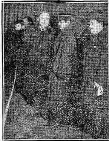
Le général Mangin devant le Diorama

Sous les auspices de l'Union Nationale des Combattants, le peintre Charles Fou- queray, a brossé un diorama représentant une vue d'ensemble de l'historique fort de