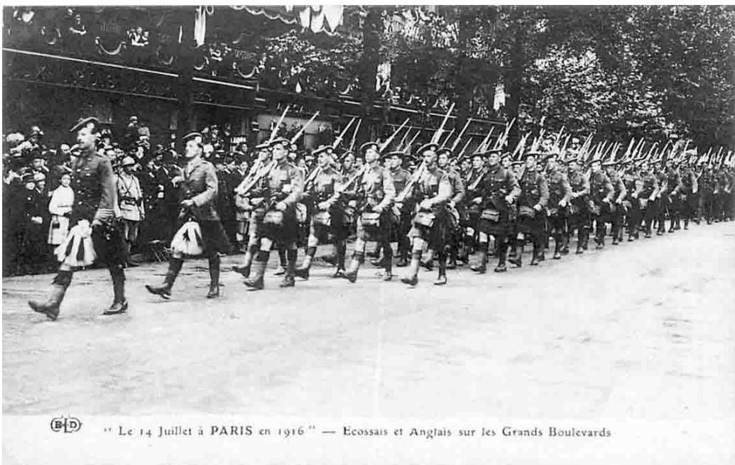
(B.D) "Le 14 Juillet à PARIS en 1916" — Ecosais et Anglais sur les Grands Boulevards