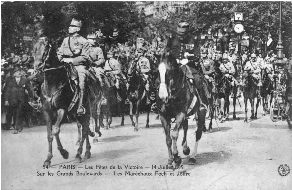
54 — PARIS — Les Fêtes de la Victoire — 14 Juillet 1919 Sur les Grands Boulevards — Les Maréchaux Foch et Joffre