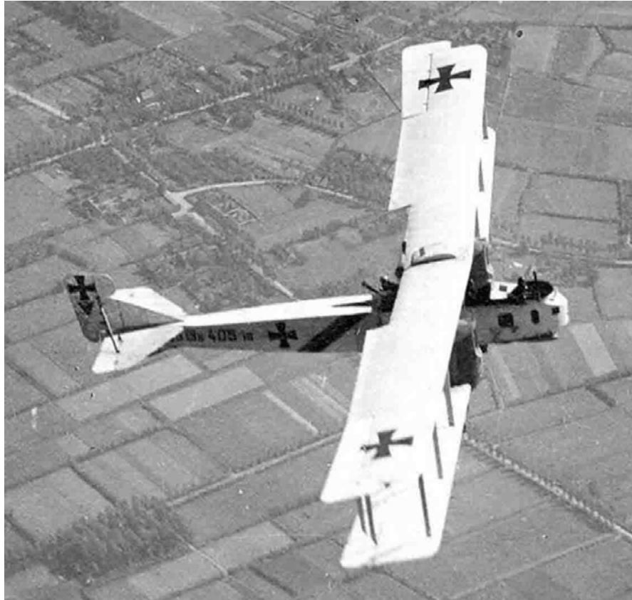
Un « Gotha » avion mise au point au début de 1918.