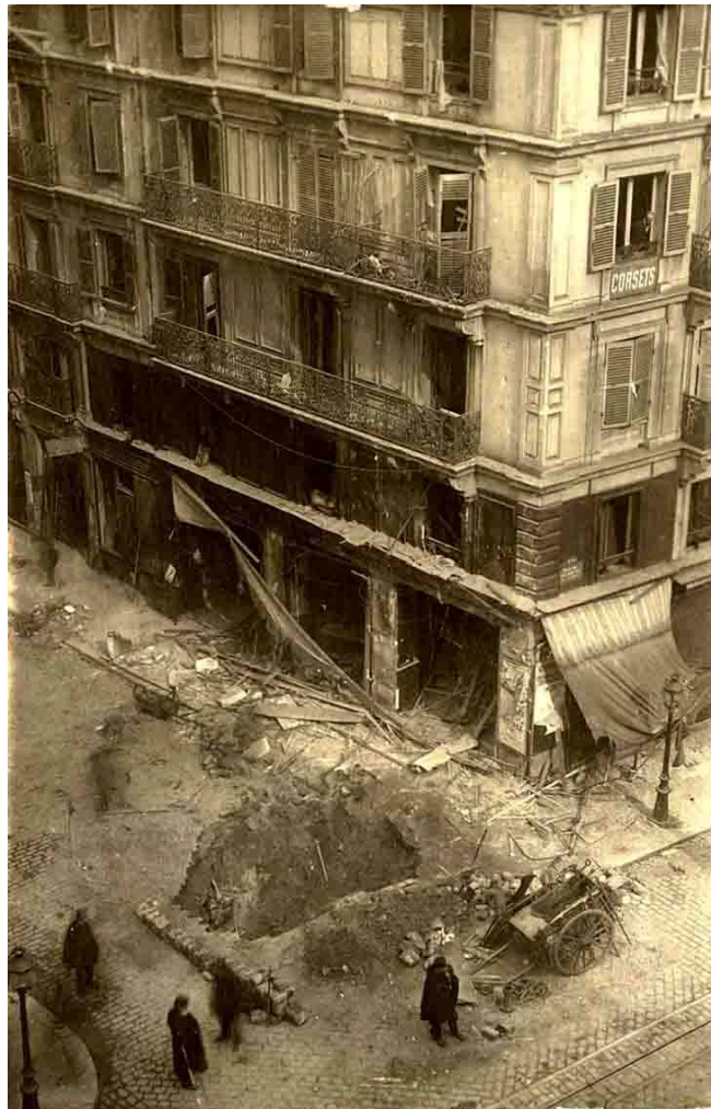
Bombe lâchée par un Gotha, le 11 mars 1918, à l'angle des rues du Faubourg-du-Temple et de l'Entrepôt (Yves-Toudic)