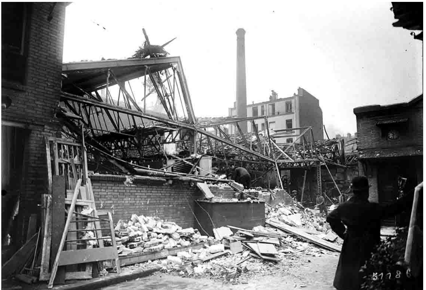
Bombe lâchée par un Gotha, le 11 mars 1918, 83 rue du Faubourg-du-Temple