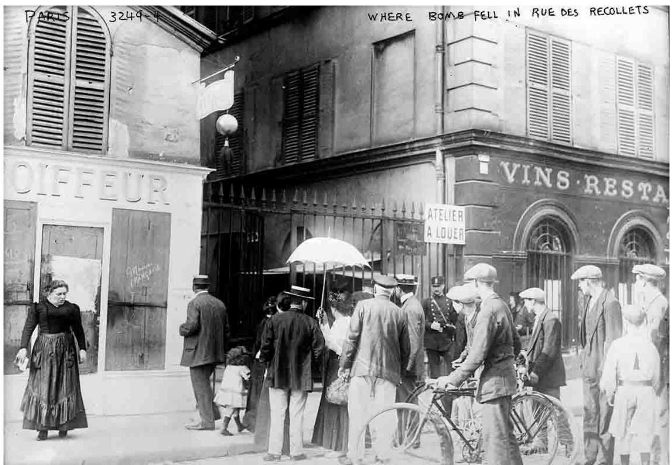
Bombe lâchée par un Taube le 30 août 1914 sur le 7-9 rue des Récollets