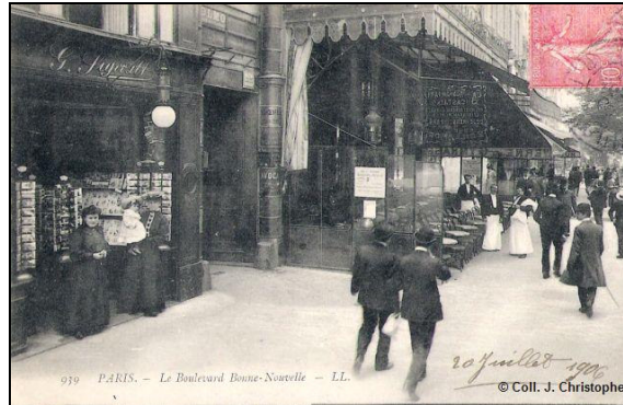
Le Boulevard Bonne-Nouvelle faisait partie du boulevard du Crime