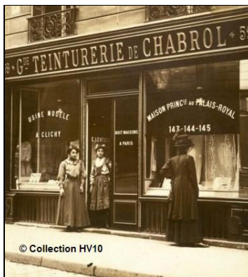
Une carte-photo du 10 e

7) Samedi 28 et Dimanche 29 novembre : XII e colloque de la Fédération des Sociétés historiques de Paris et de l'Île de France ( http://www.histoire-paris-idf.org/index.html ) : « L'Histoire des migrations et de l'immigration en Île de France ». Le Colloque se tiendra à l'Hôtel du Département de Créteil. Les modalités d'inscription seront données en temps voulu.