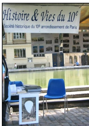
Le stand d'HV10 en 2008