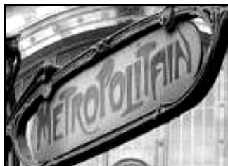
Entrée du métro gare du Nord par Guimard