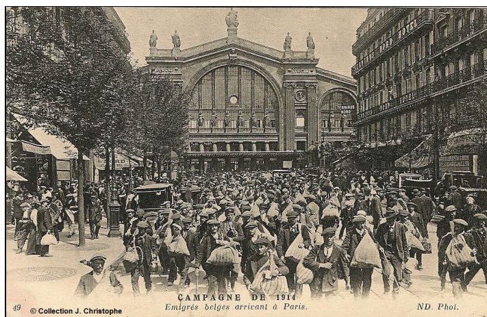
Émigrés belges arrivant gare du Nord (guerre 14-18)

7) Samedi 28 et Dimanche 29 novembre : XII e colloque de la Fédération des Sociétés historiques de Paris et de l'Île de France ( http://www.histoire-paris-idf.org/index.html ) : « L'Histoire des migrations et de l'immigration en Île de France ». Le Colloque se tiendra à l'Hôtel du Département de Créteil. Les modalités d'inscription seront données en temps voulu.