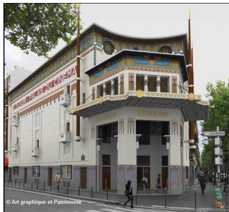
Le Louxor après restauration (conception Ph. Pumain)

4) Jeudi 8 octobre à 19h : Mairie du 9 e , 6 rue Drouot, (entrée libre), les associations « Histoire et Vies du 10 e », « Les Amis du Louxor » ( http://www.lesamisdulouxor.fr ) et « 9 e Histoire » présentent la première des « Conférences du Louxor » intitulée « Pourquoi l'Égyptomanie ? » par Jean-Marcel Humbert, conservateur général du patrimoine.