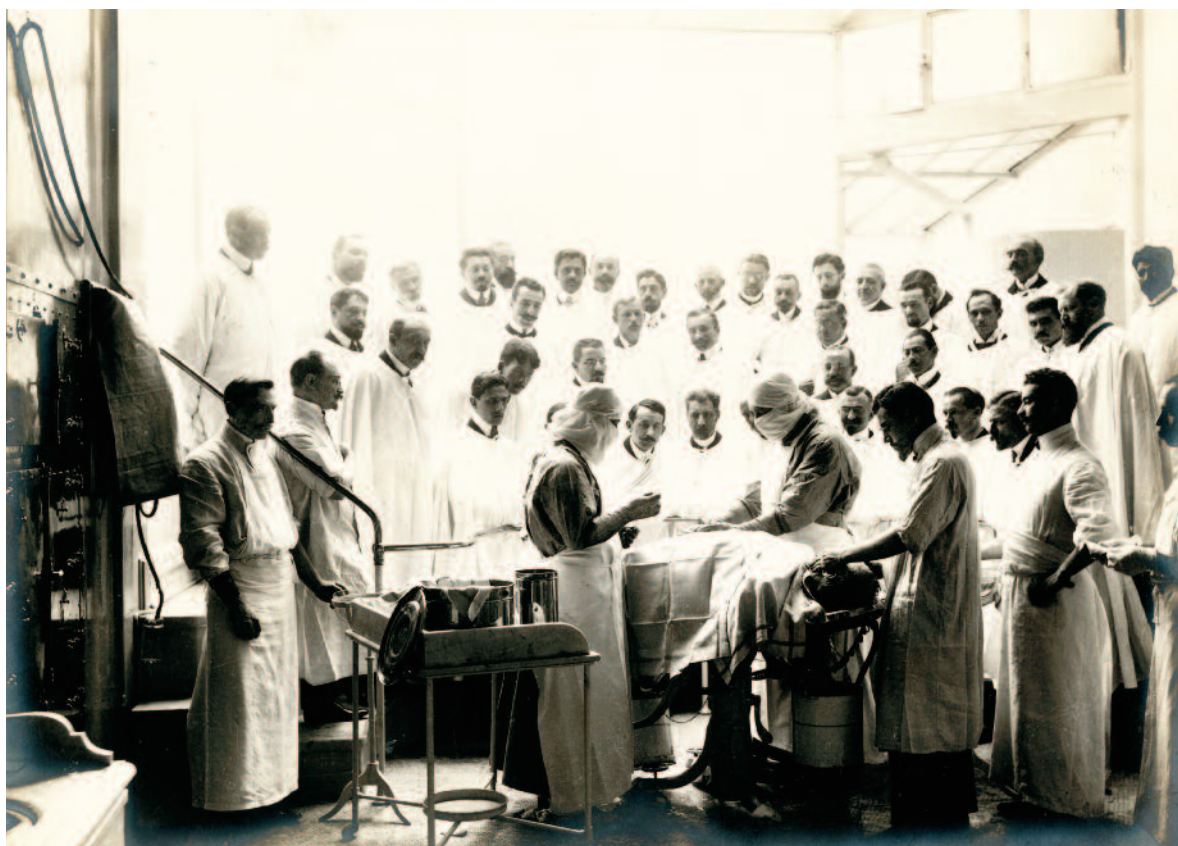
Démonstration per-opé- ratoire d'Eugène Doyen