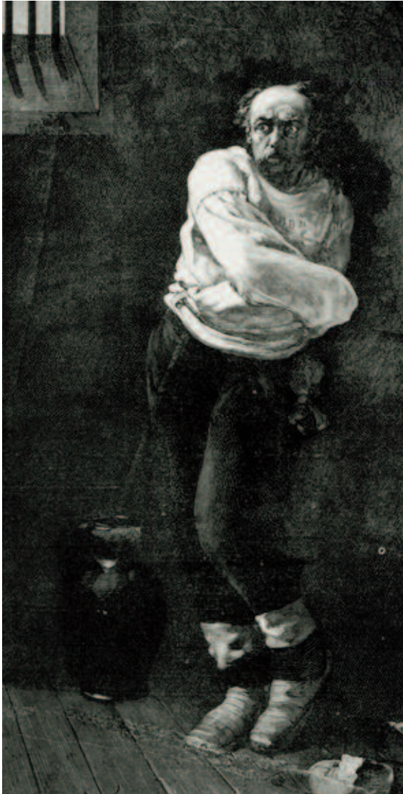
Le Fou, André Gilles

L'hôpital compte au XIX e un personnel de plus en plus nombreux et de plus en plus varié : entre 1849 et 1930, les effectifs de l'Assistance publique de Paris sont multipliés par sept, passant de moins de 2 900 à plus de 20 000 personnes.