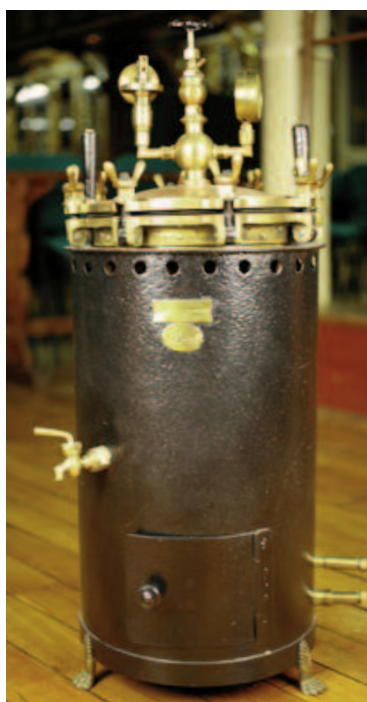
Appareil à anesthésie de Dubois

Stérilisateur à instruments