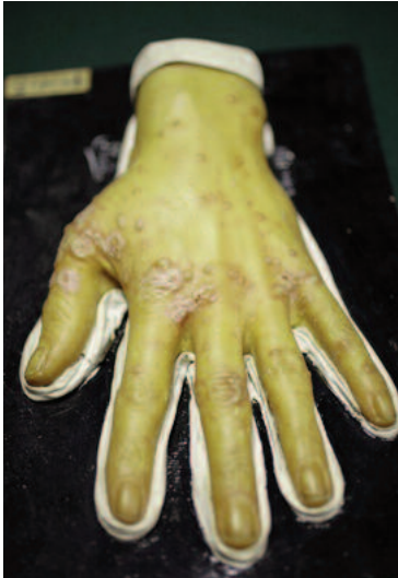
Main galeuse

Francis Démier, professeur d'histoire contemporaine à l'Université de Paris X-Nanterre