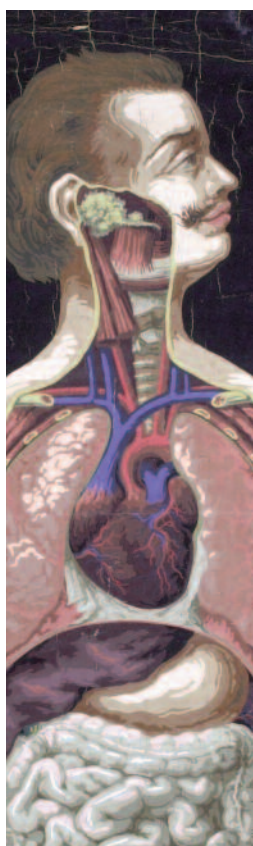
Planche anatomique

Médecins et malades dans les hôpitaux parisiens au XIX e siècle