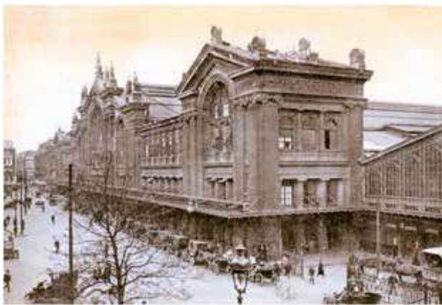
Gare du Nord en 1914, les taxis, Coll. LAMMING Publiée par Direct Matin – 18 avril 2014

Des colonnes métalliques à fût creux, entre les deux halles accolées derrière la façade, permettaient de recueillir les eaux de pluie.