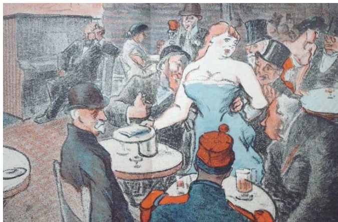
La vie d'artiste

Au-delà du folklore caf'conc' traditionnel, est proposée une vue d'ensemble du café-concert et de son système économique et social : le travail et la vie quotidienne des artistes, les « genres » et les chansons, les publics et les salles, la réglementation et la censure, les financeurs et la publicité.