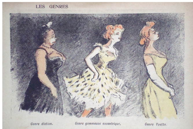
Le fonctionnement des troupes

Parmi les centaines de cafés-concerts français, certains des plus célèbres ont brillé dans le 10 ème arrondissement de Paris. Scala et Eldorado fastueux et « beuglants » sordides accueillirent diseurs, goualeuses, comiques troupiers ou excentriques, entourés de musiciens, danseurs, mimes et attractions. Des artistes comme Thérèse et Dranem, Mayol ou Y. Guilbert sont restés des mythes, et beaucoup des chansons de l'époque, hilarantes, osées, politiques, patriotiques ou sentimentales, se chantent encore, du Temps des cerises aux « scies » genre Viens poupoule !