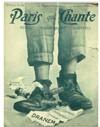
Le règne de la presse, de l'affiche et du petit-format