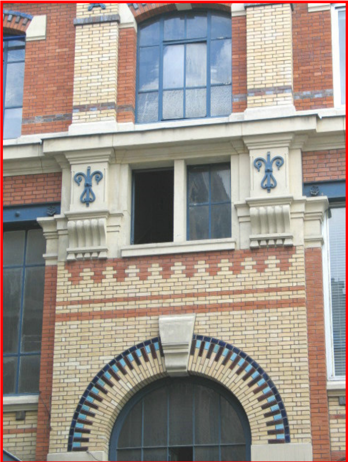
12, rue Martel