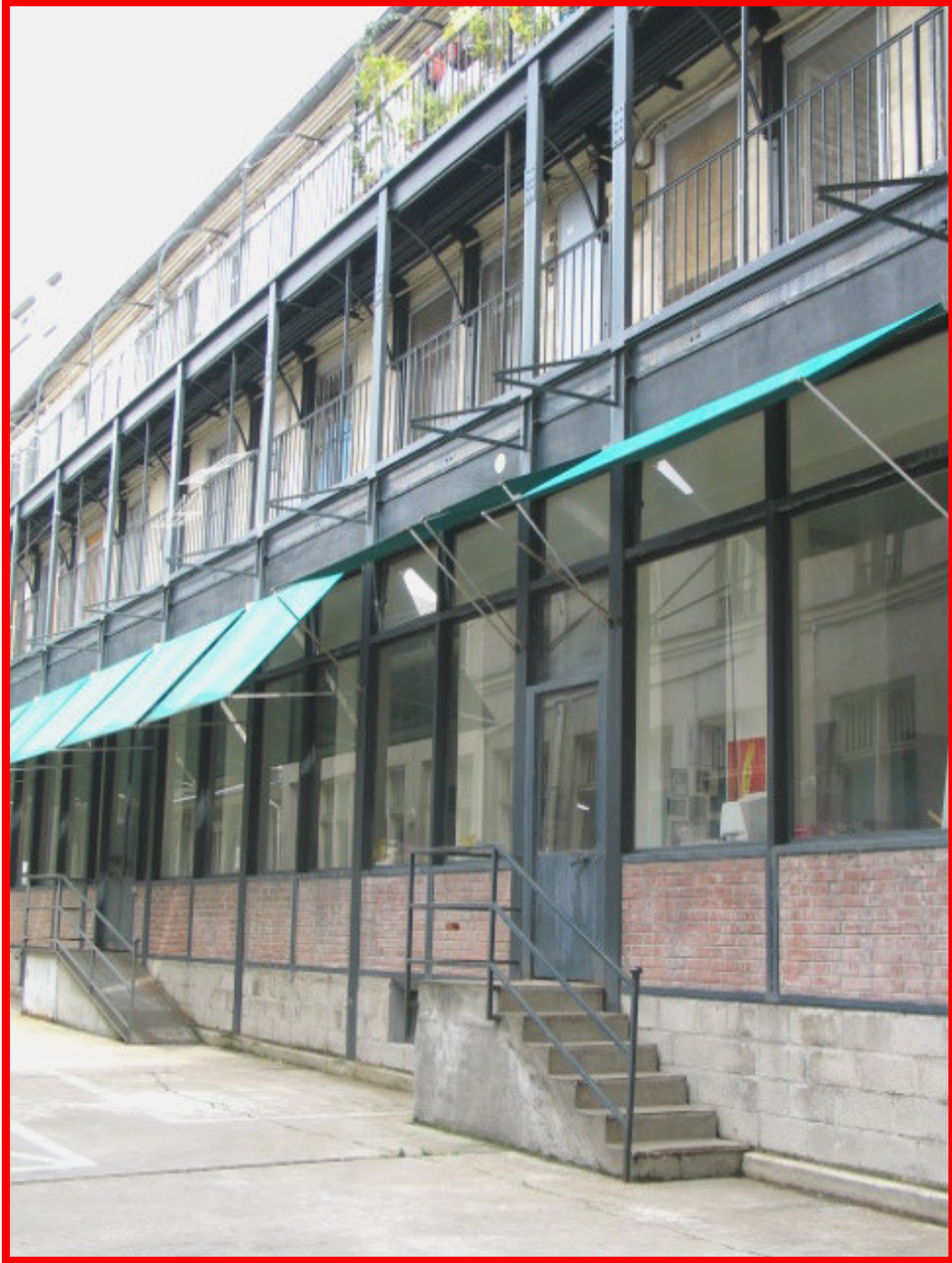
23, rue du Buisson Saint-Louis