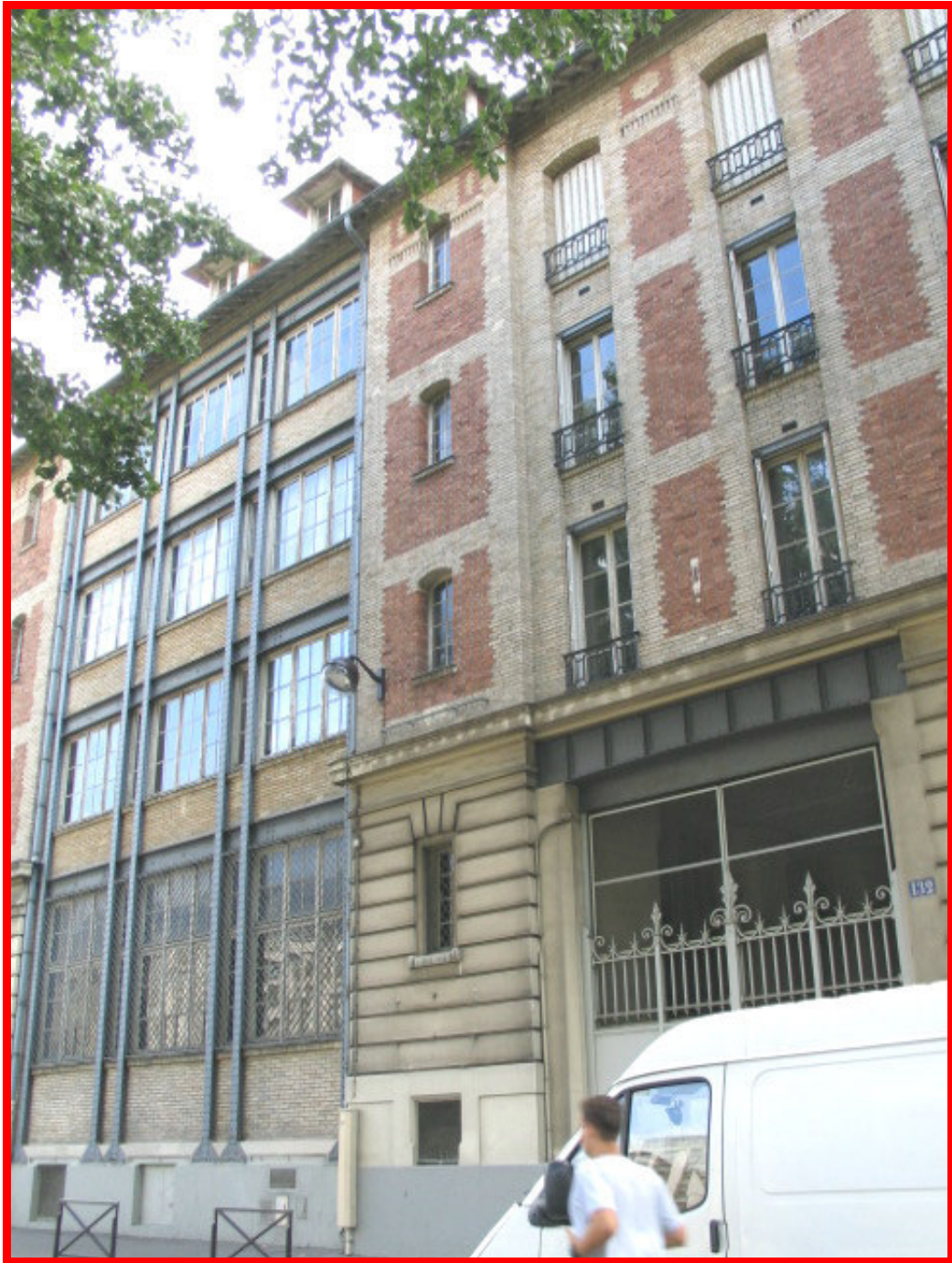
132-134, quai de Jemmapes