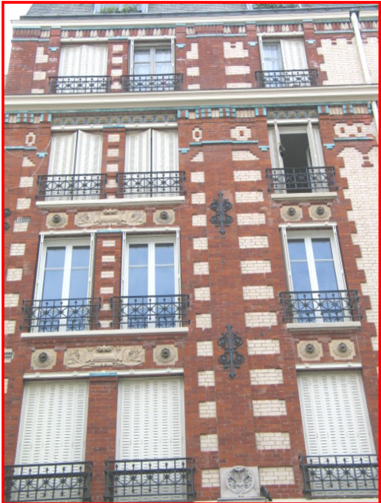
12-14, rue du Buisson Saint-Louis