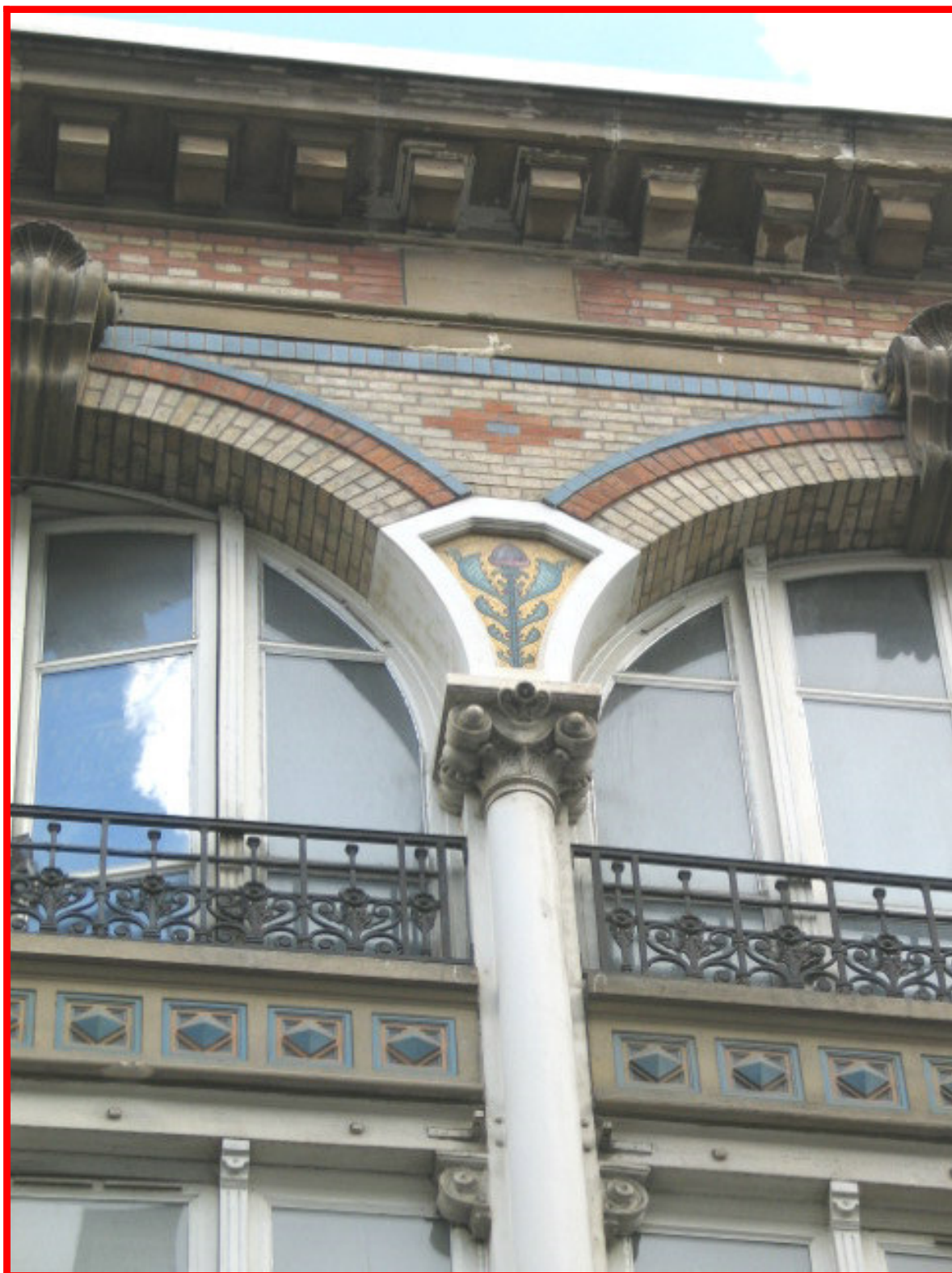
16, rue d'Enghien