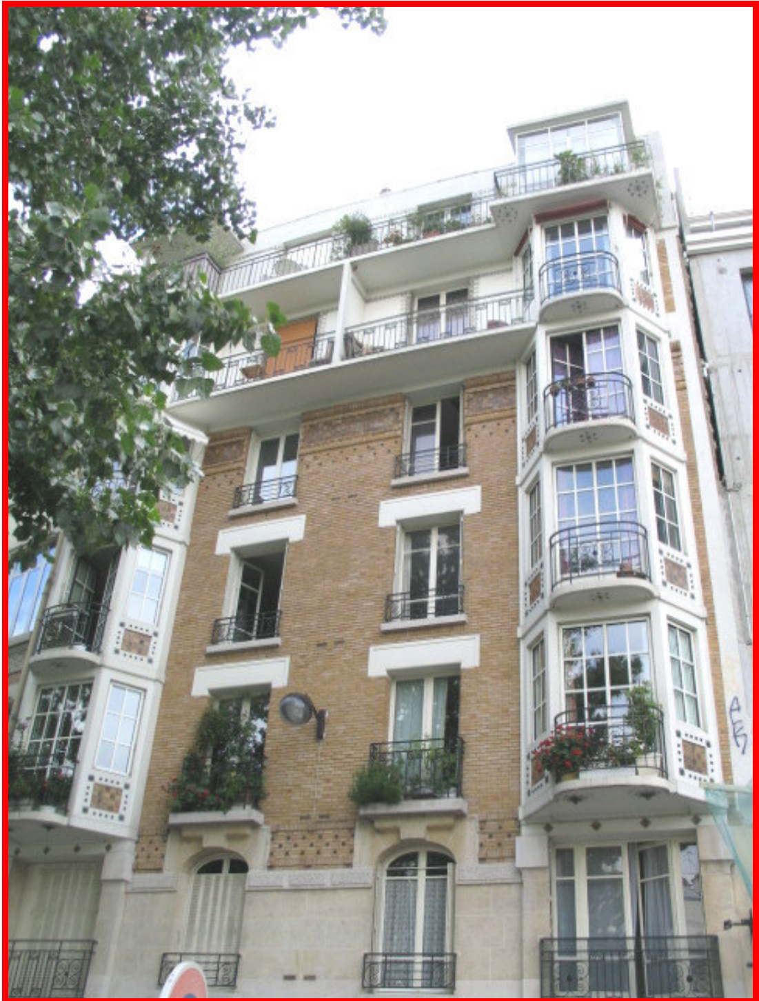
114, quai de Jemmapes