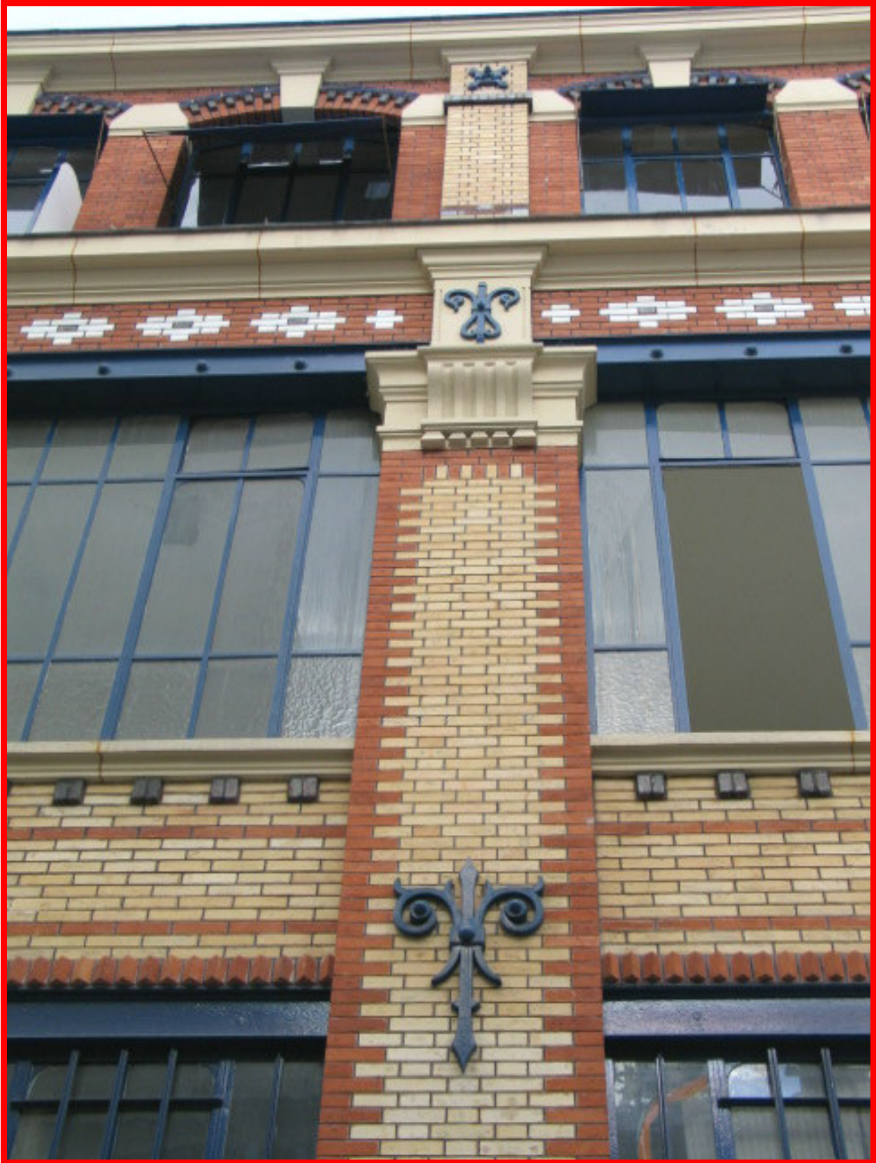
12, rue Martel